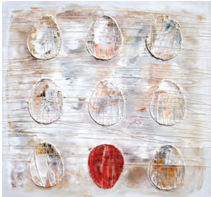
Nie , 3x 50x50, akryl na płótnie, 2012