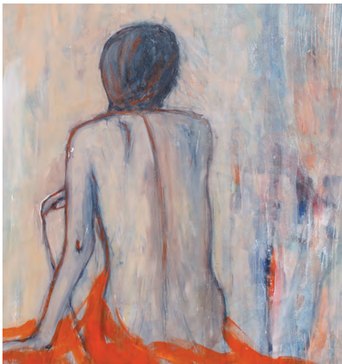
Zamyślenie , 100x100, akryl na płótnie, 2025