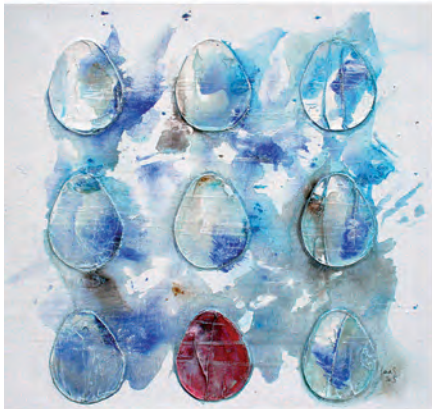
Nie , 3x 50x50, akryl na płótnie, 2015