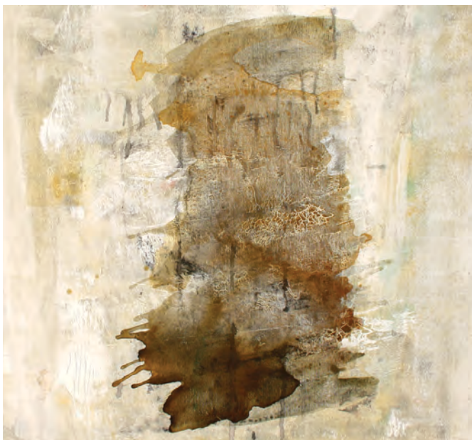
Bez tytułu , 50x100, akryl na płótnie, 2025