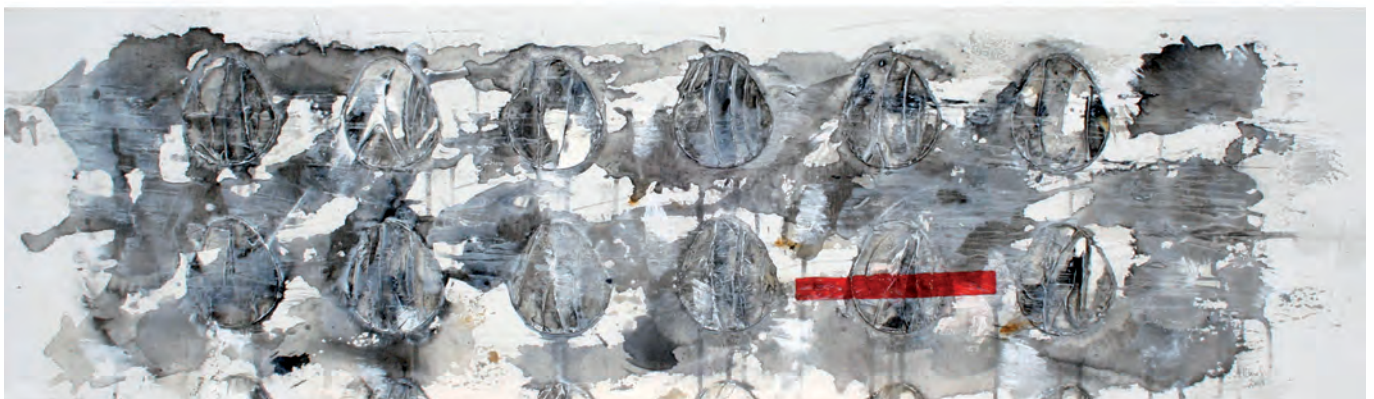
Nie , 120x40, akryl na płótnie, 2015