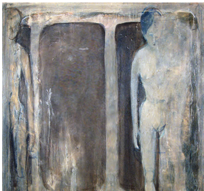
Stojąca , 100x120, akryl na płótnie, 2025