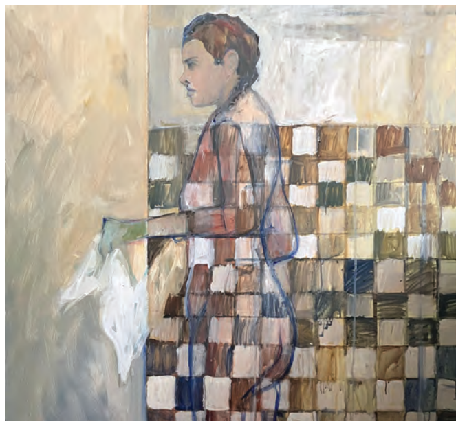
Wanna I , 100x100, akryl na płótnie, 2025