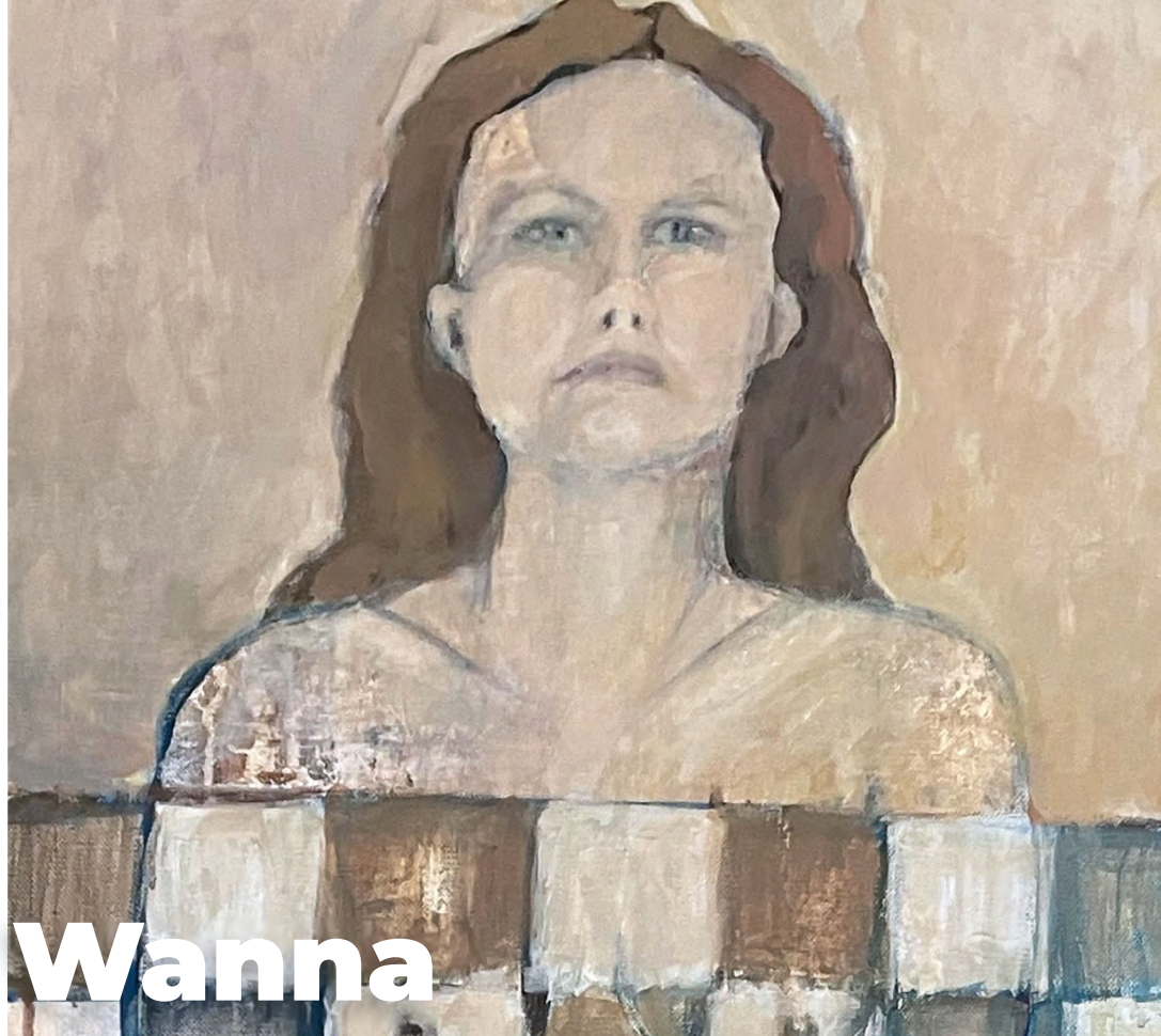
Wanna II, 120x40, akryl na płótnie, 2025, (fragment)